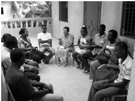
Participants à Léogane

Le concept charnière du modèle théorique est devenu concret : « la représentation différenciée de soi est à la base de la représentation différenciée de l'entourage et des autres. » 14